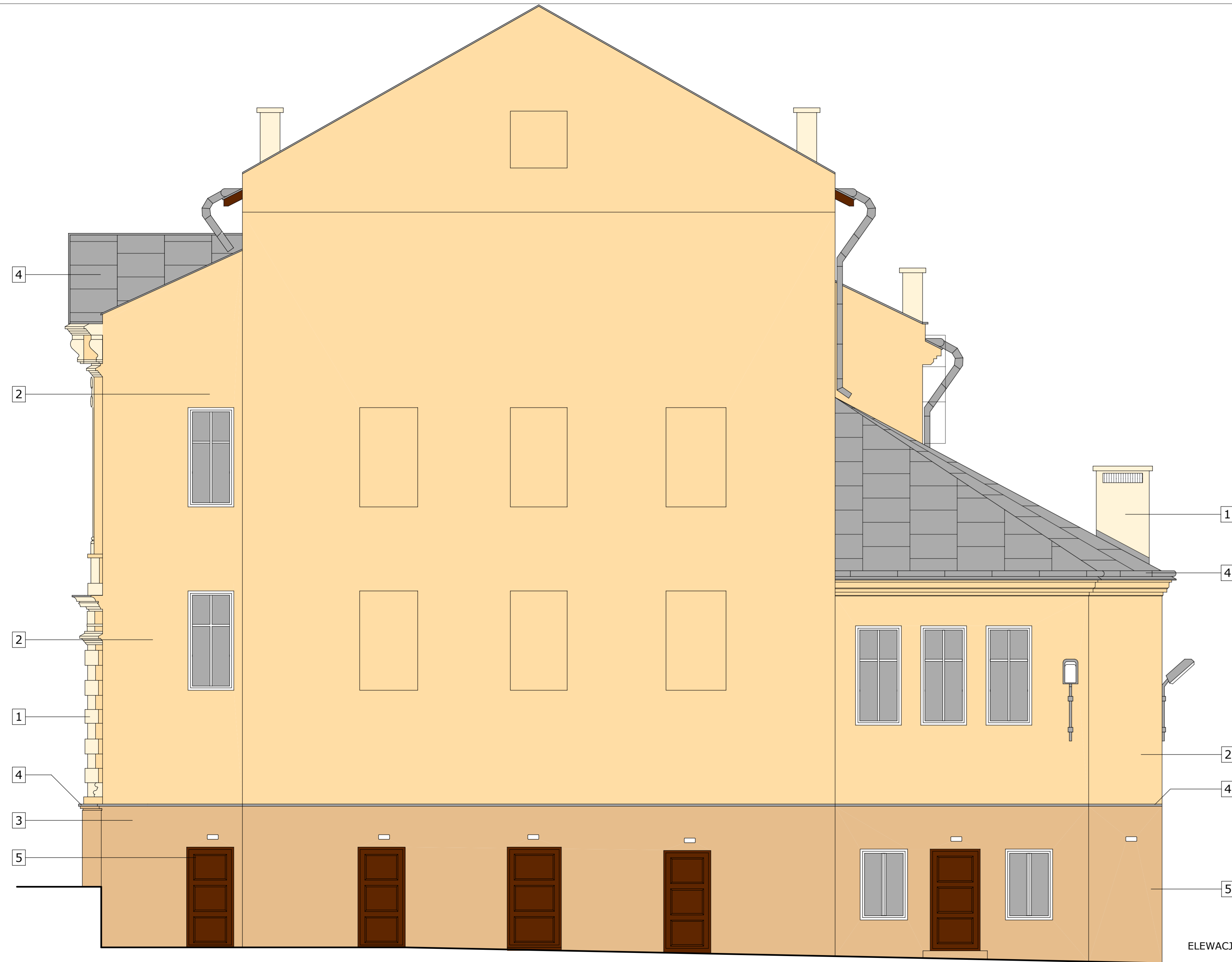
ELEWACJA WSCHODNIA I